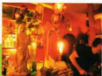
...im Kloster ...