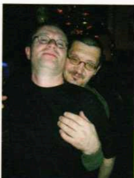
...und im Cafe Max.