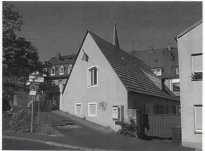
Würzburger Schwulenzentrum WUF Niggelweg 2, 97082 Würzburg

Zum Geburtstag der Veranstaltungsreihe am 2. Mai 2006 , wird ab 20.00 Uhr aus Ilse Aichinger "Schlechte Wörter" gelesen. Gäste sind natürlich herzlich willkommen! "Auch für die kommenden Monate gibt es schon ein Programm", so Andreas Roser, der die Lesungen koordiniert. Informationen zum weiteren literarischen Fahrplan 2006 kann man unter www.wuf-zentrum.de abrufen.