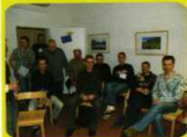
uferlos - Bamberg

Golden Friday 22 h Mit den Golden Girls auf Großbildleinwand (jede Hausmarke 0,99 ct). Jeden Freitag. WunderBAR, Pfeiffergasse 2a Nürnberg